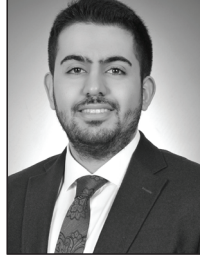
AV. ABDÜLKADİR GÜZELOĞLU